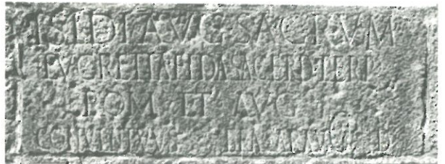
Inscripción de Outeiro Jusão