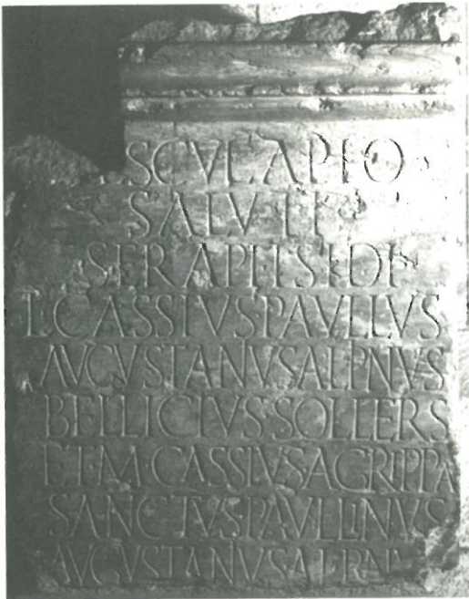
Inscripción de Legio (León)