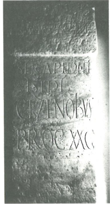
Inscripción de Asturica Augusta (Astorga)