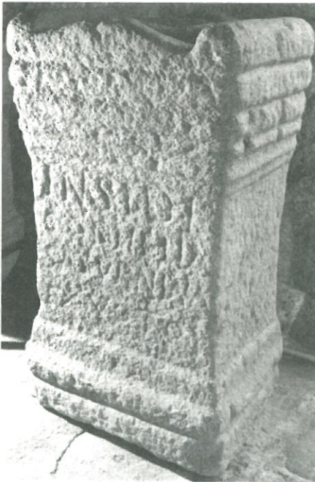
Inscripción de Bracara Augusta (Braga)