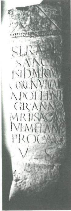
Inscripción de Asturica Augusta (Astorga)