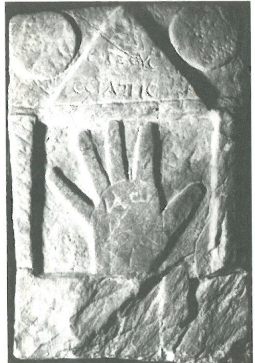
Inscripción de Quintanilla de Somoza (León)