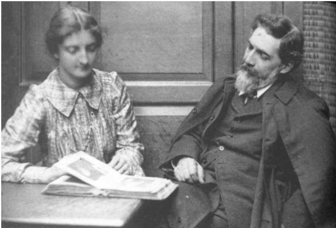
Figura 1: Hilda Umlin y Flinders Petrie

Actualmente, muchas de las piezas descubiertas por Petrie se conservan en el Petrie Museum of Egyptian and Sudanese Archaeology de Londres. Hoy en día, Petrie sigue siendo recordado como uno de los arqueólogos más influyentes de la historia y como un pionero en sus métodos de trabajo en arqueología.