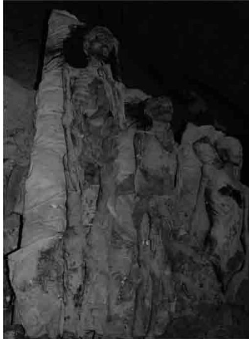
b) Les trois momies non indentifiées dans la chambre Jb de la tombe K. V. 35.